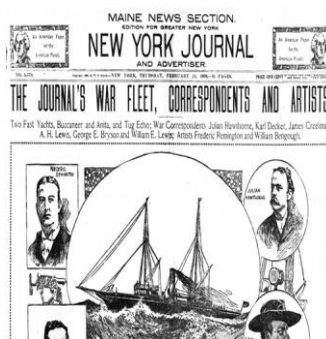
شکل ۱- اینفوگرافیک اصلی ایجاد شده در سال ۱۸۹۸: تخریب اینفوگرافیک کشتی جنگی

بسیاری از اینفوگرافیک‌های برتر در اینفوگرافیک‌های "نیویورک ژورنال" در سال ۱۸۹۸ منتشر شد (شکل ۱ و شکل ۲).