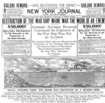
شکل ۲- اینفوگرافیک اصلی در سال ۱۸۹۸: ناوگان جنگی مجله، خبرنگاران و هنرمندان

در زمان‌های قدیم روابط عمومی، داستان‌گویی بود ولی امروزه، به نمایش در آوردن آن است و "ریچارد ادلمن" ۵ ، رئیس و مدیر عامل شرکت ادلمن، در همان زمان داستان را بیان می‌کند. سرنلی و همکارانش نیز، از تکنیک‌های اینفوگرافیک برای ترکیب طرح‌واره‌های تحلیلی و ترکیبی، جهت تقویت ادراک زیبایی شناختی استفاده و گزارش کرده‌اند که اینفوگرافیک به فرآیند یادگیری کاربران کمک می‌کند.